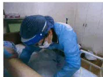
訪問看護ステーションおおみち (大阪府)