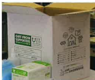
N訪問看護ステーション (S県)