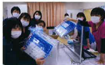
訪問看護ステーション喜 (静岡県)