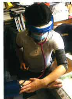
おもて参道訪問看護ステーション (東京都)