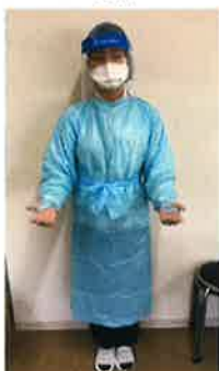
訪問看護ステーションハートフリーやすらぎ (大阪府)