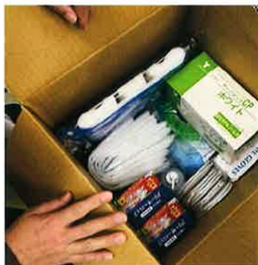
K訪問看護ステーション (D県)