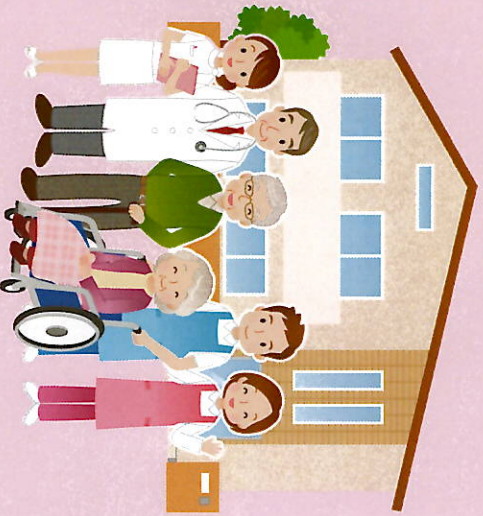
※掲載の写真はイメージです。

近隣の医療機関、 包括支援センター、 介護支援専門員などの各分野と 連携してその一番良い方法で サービス提供をいたします。 また、病気の予防、回復を目指した ライフスタイルを 一緒に考えます。