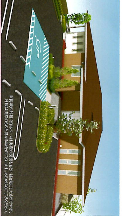
※掲載の外観・室内写真は掲載の図面を元に描き起こしたもので、実際とは多少異なる場合があります。あらかじめご了承ください。

近隣の医療機関、 包括支援センター、 介護支援専門員などの各分野と 連携してその一番良い方法で サービス提供をいたします。 また、病気の予防、回復を目指した ライフスタイルを 一緒に考えます。